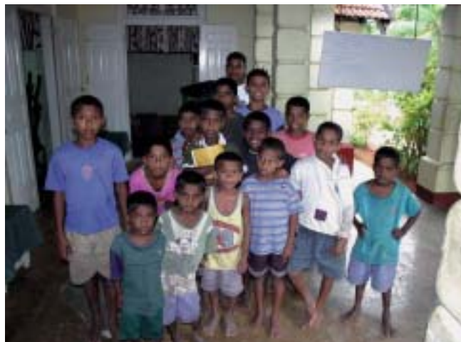
De jongens van het weeshuis in Hikkaduwa

Met uw bestelling draagt u tevens bij aan een project dat wij hopen te realiseren met de opbrengsten van de kalender. Wij willen aan het Baranasooriya Childrens Home in Hikkaduwa een computer schenken. Hiermee kunnen de jongens in dit weeshuis kennismaken met een computer waar zij later in hun opleiding hun voordeel mee kunnen doen.