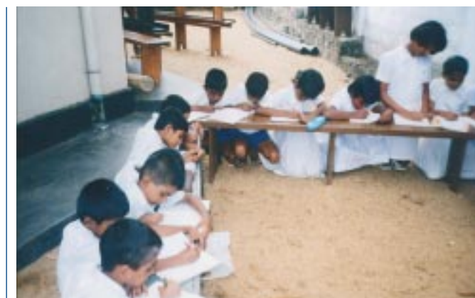
Kinderen hebben buiten les in Kapuwagara

kelijk zijn. De priester van de kerk van Kapuwagara wil zich voor hen inzetten en heeft reeds grond voor de Community Hall beschikbaar gesteld. De kosten voor de nieuwbouw zijn geraamd op € 18.000,-. Hiermee kan de jeugd van Kapuwagara een onderdak worden geboden voor hun onderwijs en andere gezamenlijke activiteiten. Wanneer u dit project wilt steunen kan dat door bij uw bijdrage 'Project Kapuwagara' te vermelden. Ook voor het project 'Jeevanie's Children Home' is uw gift nog steeds welkom. Dit betreft een weeshuis waarvan de vloer van de derde verdieping vernieuwd moet worden en dat dringend een nieuw dak nodig heeft. Voor meer informatie over projecten kunt u terecht bij ons kantoor in Groenlo.