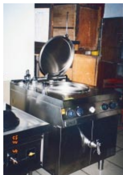
De nieuwe keukenapparatuur staat te glimmen