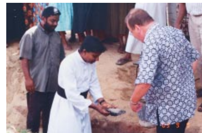
1e steenlegging Daraluwa pre-school

In het afgelopen jaar hebben wij weer veel projecten kunnen verwezenlijken dankzij uw bijdragen! Projecten waarvoor dit jaar uw aandacht werd gevraagd zijn nu in aanbouw. In de Community Hall in Nagoda zal volgend jaar een vakopleiding van start gaan, en in Daraluwa hebben binnenkort ook de kleuters een eigen schoolgebouw. Nu hebben wij het verzoek voor opnieuw een Community Hall, dit keer in Kapuwagara, een klein dorpje 16 km van Colombo. In dit arme dorp wonen ca. 400 jongeren onder de 16 jaar die voor hun toekomst van hun omgeving afhan-