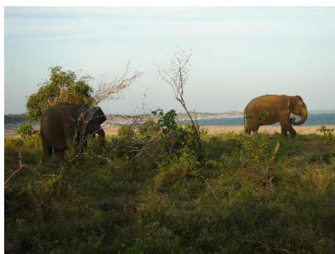
Yala N.P. safari

Na het ontbijt vertrekken we naar Tissamaharama oftewel Tissa. Onderweg bezoeken we de Rawana watervallen in Ella. Aankomst bij ons hotel in Tissamaharama. In de late namiddag gaat u op safari in het Yala National Park in jeeps, vergezeld van een ranger (parkwacht) Een avontuurlijke ervaring, olifanten kruisen vrijwel zeker uw pad! Verder leven in het park : luipaarden, krokodillen, gazellen, varanen, mungo's (wilde zwijnen), waterbuffels, pauwen, pelikanen, ooievaars en een fascinerende hoeveelheid felgekleurde tropische vogels. Na afloop keren we terug in ons hotel voor diner en overnachting.