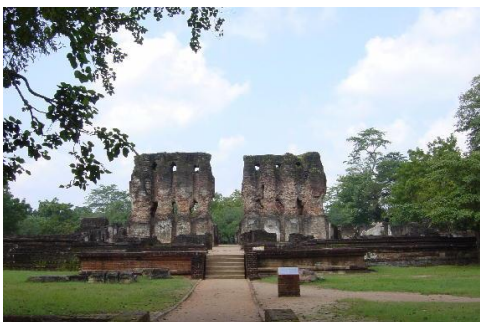
Het antieke Polonnaruwa

Na het ontbijt gaan we op pad voor de city tour in de antieke stad Polonnaruwa met de enorme liggende Boeddha (15 meter) en de restanten van het koninklijk paleis. Deze antieke stad werd na eeuwen overwoekerd te zijn door het oerwoud in de vorige eeuw herontdekt en opgegraven. We bezoeken ook de Parakkrama Samudraya waterwerken (tank), bijna 2500 jaar geleden aangelegd door Koning Parakkramabahu. Daarna keren we terug naar het hotel voor diner en overnachting.