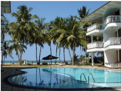
Uw beach hotel in Marawila

Bij aankomst op de luchthaven van Colombo wordt u afgehaald en maakt u kennis met uw chauffeur/gids die u ook op uw rondreis zal begeleiden. Hij brengt u naar uw beach hotel in Marawila (28 km. van de luchthaven). Dit hotel is schitterend gelegen, direct aan het strand van de Indische Oceaan. Het beschikt over een prachtige tropische tuin en zwembad en een uitstekende keuken. Hier kunt u de rest van de dag van uw reisvermoeienissen uitrusten. 's Avonds diner en overnachting.