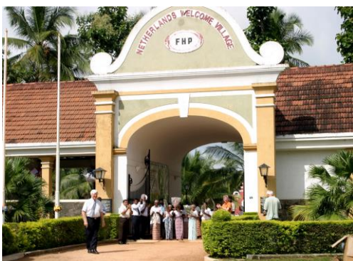
Netherlands Welcome Village

Na het ontbijt wordt u afgehaald door de chauffeur voor een bezoek aan het Nederlandse Welkom Dorp. Aldaar krijgt u een rondleiding door een van de bewoners of verzorgers. U ziet o.m. de keukens, eetzaal, de dokterspost, het multireligieus gebouw dat staat voor de 4 religies van de bewoners, u wandelt door de hollands ogende straatjes. Kortom, een kijkje in het dagelijks reilen en zeilen van het Welkom Dorp. De middag heeft u ter beschikking om nog even te acclimatiseren en te genieten aan het strand, in het zwembad of in de prachtige tropische tuin. U kunt er genieten van een prachtige zonsondergang. Diner en overnachting.