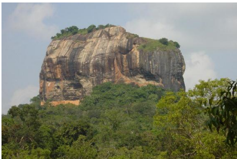
Sigiriya, de Leeuwenrots

Ontbijt in het hotel en vertrek naar de koningsstad Polonnaruwa. Onderweg beklimmen we de beroemde Leeuwenrots van Sigiriya met op de top het fort dat koning Kasyapa er in de 5 e eeuw heeft gebouwd. Halverwege de beklimming ziet u de resten van wunderschone zeer oude fresco's die koning Kasyapa er liet aanbrengen. Boven gekomen op 200 m. hoogte geniet u van een adembenemend uitzicht! Eind van de middag aankomst in het hotel in Polonnaruwa voor diner en overnachting.