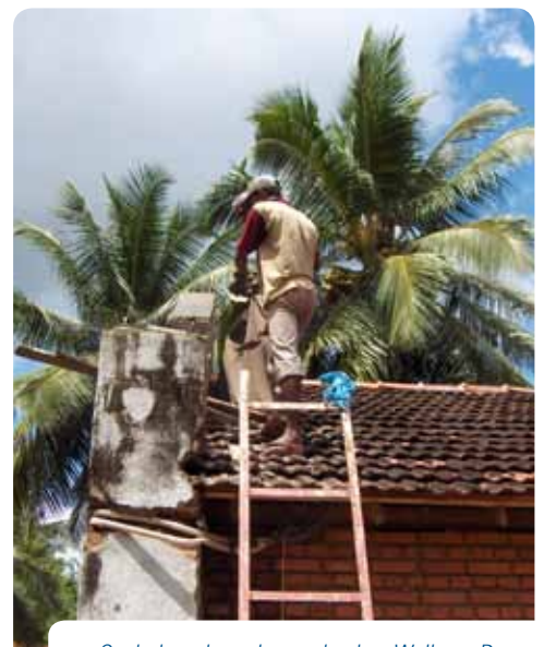
Onderhoudswerkzaamheden Welkom Dorp

Family Help Programme biedt hiertoe op Sri Lanka de mogelijkheid om werkzaamheden te verrichten in het Welkom Dorp. Op deze manier kunnen FOX-reizigers naast een mooie vakantie de lokale bevolking een handje helpen en zo het land echt leren kennen. De deelname aan het FOX Feel Good pakket geschiedt onder eigen verantwoordelijkheid en FHP aanvaardt dan ook geen enkele aansprakelijkheid voor geleden schade door of voortkomend uit de verrichte werkzaamheden.