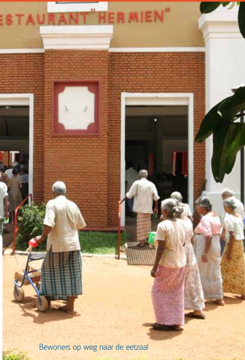
Bewoners op weg naar de eetzaal